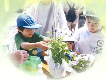
森林祭での募金活動