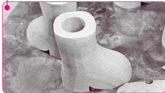
非常に固く、独特の質感を生む素材「斧折樺」