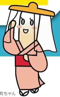
たんぽ小町ちゃん