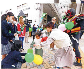
ネイガーたちも応援!