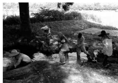
上) 花だんの植栽 下) 「左京の泉」の清掃活動