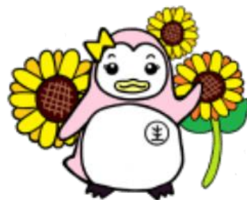
更生ペンギン サラちゃん

地域生活定着支援センターは、矯正施設を退所した高齢者や障がい者の方々が地域社会に復帰するために必要な福祉サービス等が受けられるよう支援する機関です。