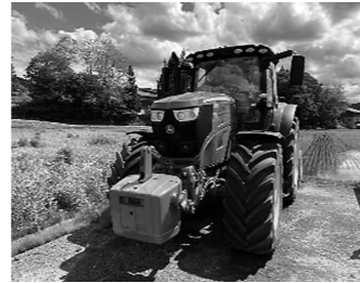
迫力ある大型トラクター