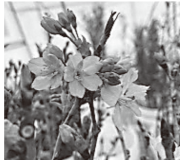
正月飾りは啓翁桜で