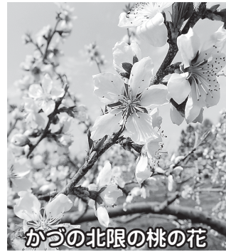
かつの北限の桃の花