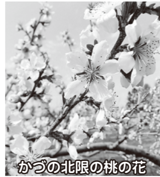
かつの北限の桃の花