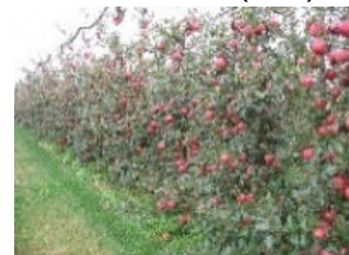
省力樹形の例 超高密植栽培(りんご)