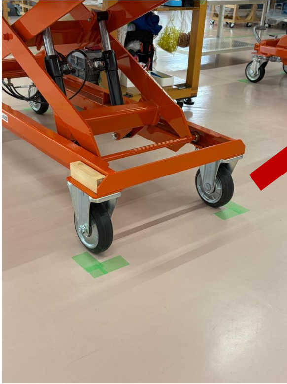
↑ 昇降台の固定位置を線で「見える化」。線を引きすることで標準を作る！

KJSでは、昇降台の置き方、固定位置の「見える化」に取り組み、作業手順書を整備しました。また資材置き場の配置ルールを定め、資材移動時間の短縮、作業者の歩行距離削減、作業効率化、生産性向上を実現していきます。