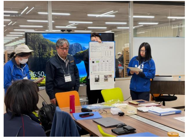
↑ルールを決め、継続して実施してもらうことで、標準を浸透させていきたい

←トヨタにおける線は、単なる仕切りではなく、究極の「見える化」ツール。「正常」と「異常」を一瞬で判別するための基準となる。線で基準を定めることで、「5S」や「定位・定量・定品」に繋がる！