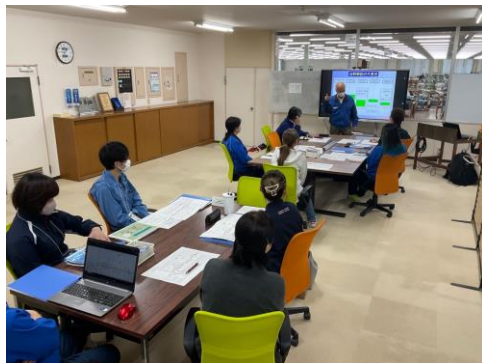
〈山本先生からの改善活動基礎講座〉

10月15・16日に第3回のかづの人づくり塾が開催されました。「標準作業と改善」について、稼働解析の手法や改善に向けた着想の考え方などを座学で学んだのち、各班それぞれのテーマに沿った現場視察、改善提案に向けた意見交換を行いました。