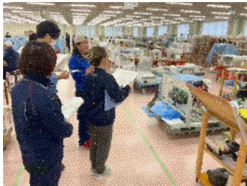
各班とも現場にて検証を行っています。