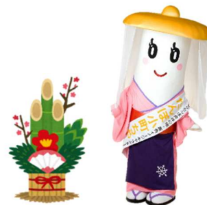
きりたんぼ発祥の地 鹿角 イメージキャラクター「たんぼ小町ちゃん」