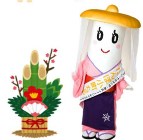
きりたんぼ発祥の地 鹿角 イメージキャラクター「たんぼ小町ちゃん」