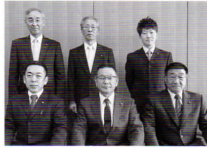
総務財政常任委員会