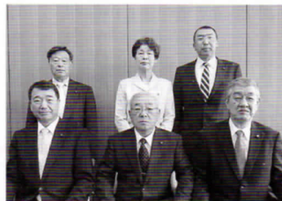
産業建設常任委員会