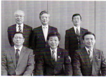
教育民生常任委員会