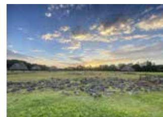
大湯環状列石 (十和田地区)

令和3(2021)年7月に世界文化遺産登録。1万年以上にわたり採集、漁労、狩猟により定住した人々の生活と精神文化を伝える北海道、青森県、岩手県、秋田県に所在する国指定の17の遺跡で構成される。