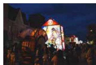
花輪ねぶた (市指定、花輪地区)