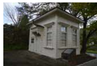
旧小坂鉱山病院記念棟 (国登録、小坂地区)

東北地方の鉱山は国内有数の金属供給源として、富国強兵・殖産興業政策に貢献し、近代産業の発展を支えた22資産で構成される。平成19(2007)年認定。