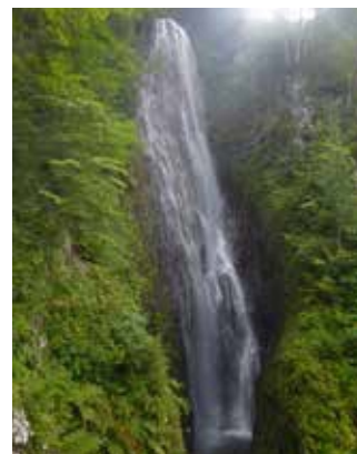
茶釜の滝 (八幡平地区)

令和5(2023)年3月に秋田県内の代表的なインフラ資産の魅力を広くPRし、小中学校の社会見学や地域の観光資源と合わせたインフラツーリズムとして活用のため、インフラ資産50箇所構成される。