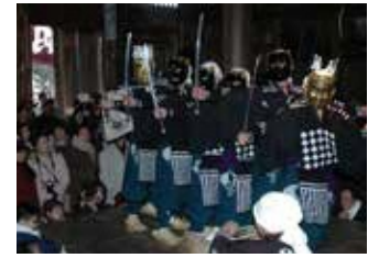
大日堂舞楽 (八幡平地区)

平成21(2009)年ユネスコ無形文化遺産登録。毎年正月2日に行われる大日靈貴神社例祭で奉納される。養老年間(717~24)に都から下向した楽人 げこう がくにん によって伝えられた舞楽が起源といわれる。八幡平地区の4集落がそれぞれ異なる舞を伝承する。