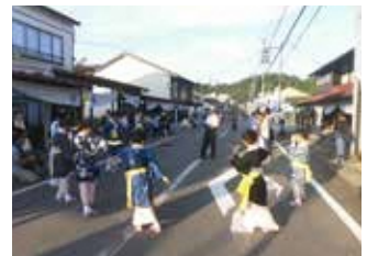
毛馬内本町通り (十和田地区)