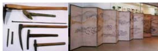
尾去沢鉱山資料(県指定、尾去沢地区)

市指定は、江戸時代後半に奉納された「月山神社の百人一首献額」(十和田地区)や「栗山家『古代かつの紫根染・茜染資料』」(花輪地区)などがある。