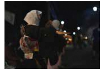
毛馬内の盆踊 (十和田地区)

平成21(2009)年にユネスコ無形文化遺産に登録された「チャッキラコ」(神奈川県三浦市)を拡張し、令和4(2022)年に登録された。華やかな、人目を惹く、という「風流」の精神を体現し、衣装や持ち物に趣向を凝らして、歌や笛、太鼓、鉦などの囃子に合わせて踊る。それぞれの地域の歴史と風土を反映し、多彩な姿で今日まで続き地域の活力の源となっている。国指定の無形の民俗文化財で構成される。