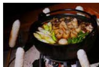
きりたんぼ (鹿角地域)