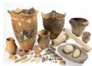
天戸森遺跡出土資料 (県指定、花輪地区)

未指定文化財は、鹿角地域で最も古い縄文時代草創期の爪形文土器(飛鳥平遺跡)や奈良・平安時代の鉄製品など、当時を知ることができる貴重な資料がある。