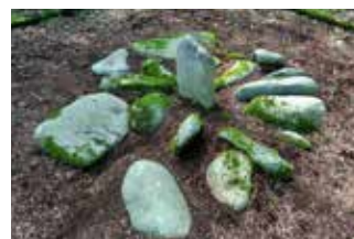
小坂環状列石墳墓 (町指定、小坂地区)

未指定文化財は、江戸時代に整備された街道である「鹿角街道」や「三戸往来」、「奥筋往来」の痕跡があり、道筋には一里塚が残るところもある。