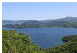
十和田湖 (国指定、小坂地区)

未指定文化財は、溪谷などがある。湯瀬溪谷は盛岡へ通じる交通の要衝で、温泉が湧き菅江真澄や杉村楚人冠がその風景を随筆などに遺した。夜明島溪谷は茶釜の滝など自然が多く遺り、八幡平地区の住民の拠り所となっている。