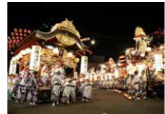
花輪祭の屋台行事 (花輪地区)

平成21(2009)年にユネスコ無形文化遺産に登録された「京都祇園祭の山鉾行事 ぎ おんまつり 」(京都府京都市)と「日立風流物 ひたちふうりゅうもの 」(茨城県日立市)を拡張し、平成28(2016)年に登録された。地域社会の安泰や災厄防除を願い、地域の人々が一体となり執り行う「山・鉾・屋台」の巡行を中心とした祭礼行事である。国指定の無形の民俗文化財で構成される。