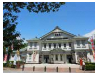
康楽館 (国指定、小坂地区)

未指定文化財は、武家や地主の住宅、コミセ(コモセ)を持つ商家があり、代官所の門などが寺院に移設され遺る。また近代化した鉱山に電気を供給する発電所や鉱山労働者の福利厚生施設も遺る。