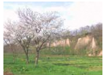
崩平の十和田火山八戸火砕流堆積層露頭 (県指定、小坂地区)