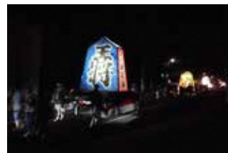
毛馬内の七夕 (十和田地区)

また、昭和初期から家庭の娯楽として百人一首かるたが親しまれ、花輪地区を中心に競技かるたが盛んである。