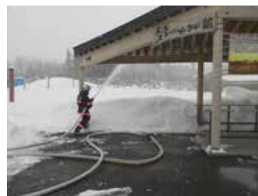
文化財防火デー (大湯ストーンサークル館・十和田地区)

鹿角市と小坂町は毎年1月26日の文化財防火デーに合わせて、文化財所蔵施設の消防立ち入り検査、消防訓練を実施している。あわせて鹿角市や小坂町の広報での周知や指定等文化財の所有者への周知を行っている。