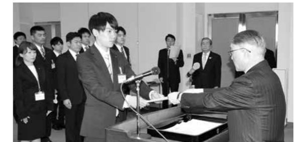
平成30年度 辞令交付式