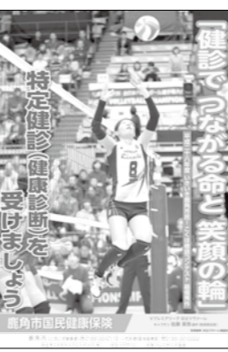
特定健診ポスター

「健康・生き生き」をテーマとした標語・写真を募集します。どなたでも応募できます。家族の健康を願った、生き生きとした作品をお待ちしています。 ▼入賞 最優秀賞1点・優秀賞2点・入賞5点 (いずれも賞状および副賞あり) ▼表彰式 かつの元気フェスタ ▼応募締切 8月4日(金)必着 ▼実施要項 各支所や市民センターに備え付けています。または、市のホームページをご覧ください。