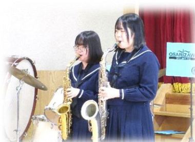
↓尾去沢中学校吹奏楽部