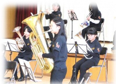
↓尾去沢小学校スクールバンド部