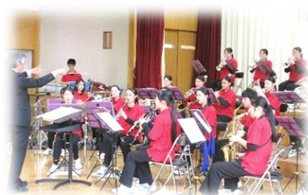
↓鹿角高等学校吹奏楽部